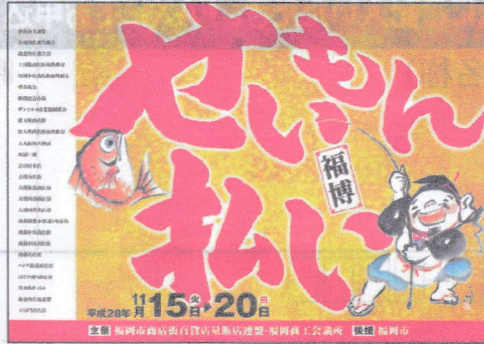
※ポスターデザインはイメージです。